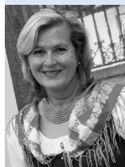
Gastreferentin Dr. Ursula Plassnik